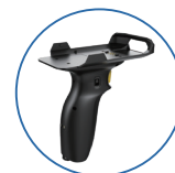
一/二维 扫描头手柄